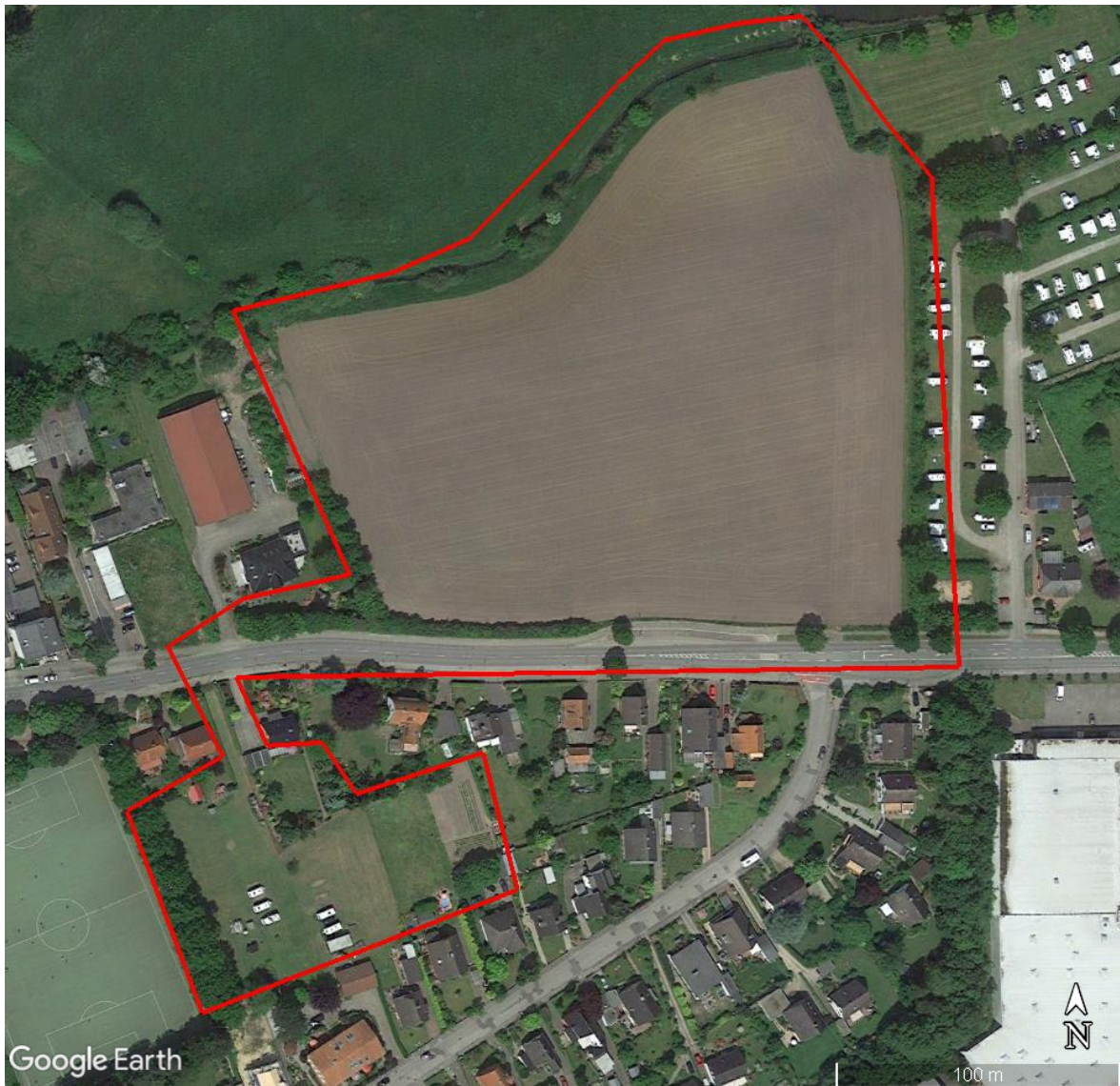
Abbildung 2: Untersuchungsgebiet (Luftbild aus Google-Earth™).

In Lübeck, Steinrader Damm soll ein Acker und ein mit Rasen bewachsenes Grundstück innerhalb einer Siedlung bebaut werden. Dafür wird ein Bebauungsplan aufgestellt. Davon können Arten, die nach § 7 (2) Nr. 13 u. 14 BNatSchG besonders oder streng geschützt sind, betroffen sein. Daher wird eine faunistische Potenzialanalyse für geeignete Artengruppen unter besonderer Berücksichtigung gefährdeter und streng geschützter Arten angefertigt. Zu untersuchen ist, ob gefährdete Arten oder artenschutzrechtlich bedeutende Gruppen im Eingriffsbereich vorkommen.