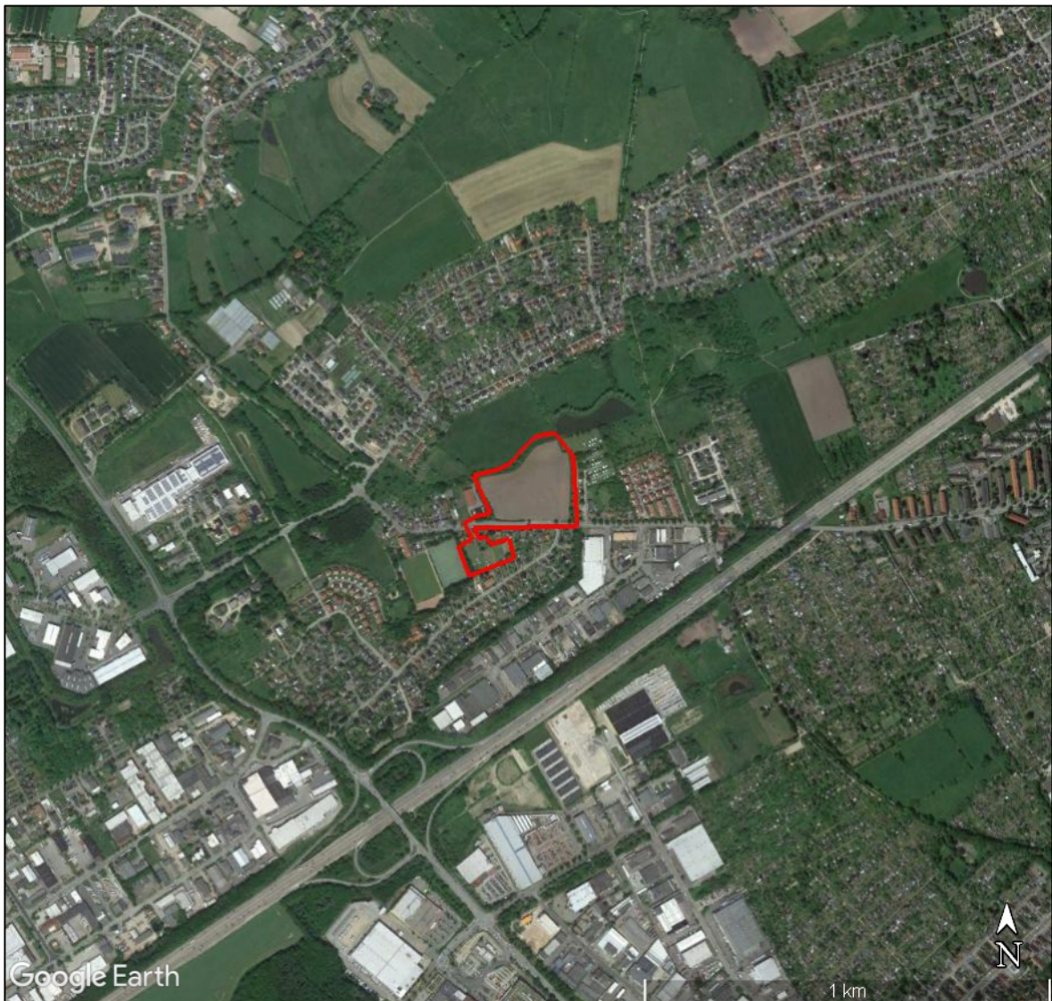
Abbildung 1: Untersuchungsgebiet (rote Linie) und 1 – km – Umfeld (Luftbild aus Google-Earth™)

Im Auftrag der Grundstücksentwicklungsgesellschaft Howingsbrook GmbH & Co. KG, Lübeck